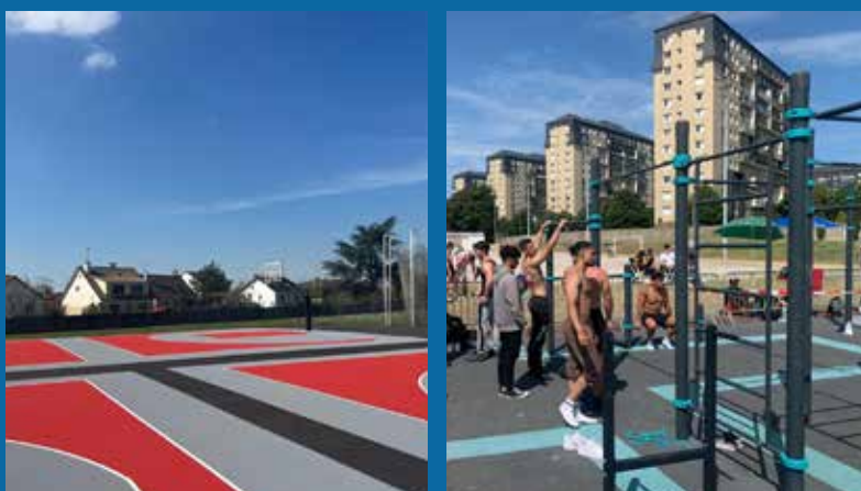
Création d'un street workout et d'un terrain de basket 3x3 en accès libre