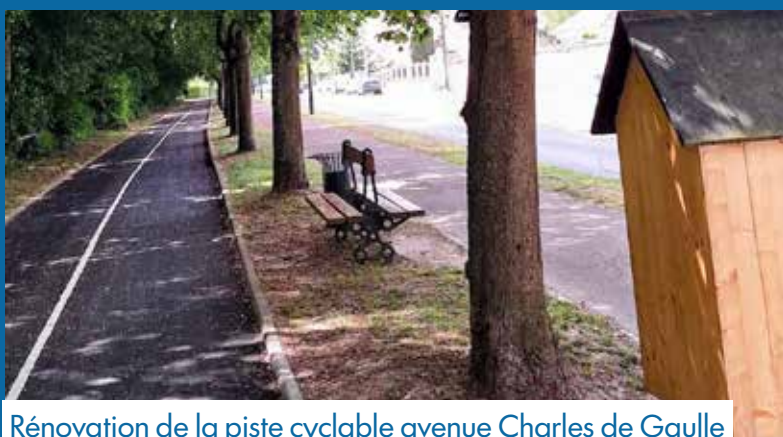
Rénovation de la piste cyclable avenue Charles de Gaulle