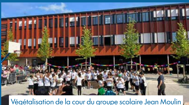
Végétalisation de la cour du groupe scolaire Jean Moulin et création d'une classe extérieure