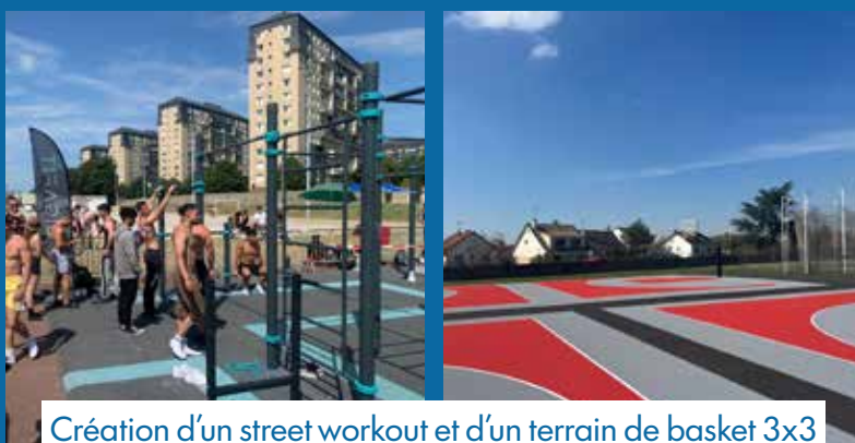
Création d'un street workout et d'un terrain de basket 3x3 en accès libre sur le stade Coubertin