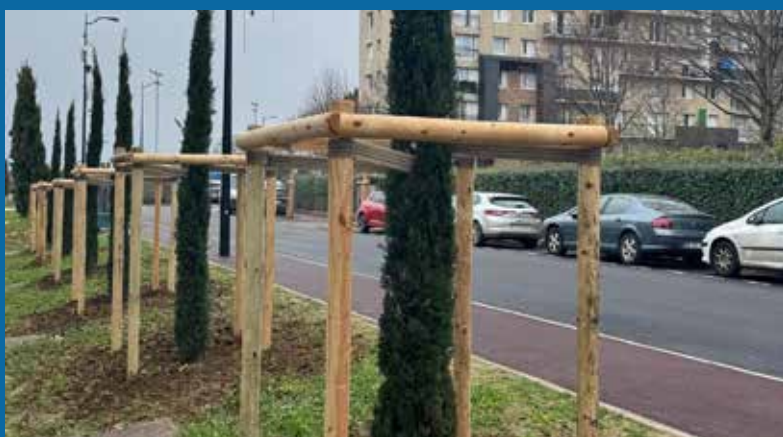
Rénovation de la rue de Mainville et enfouissement des réseaux