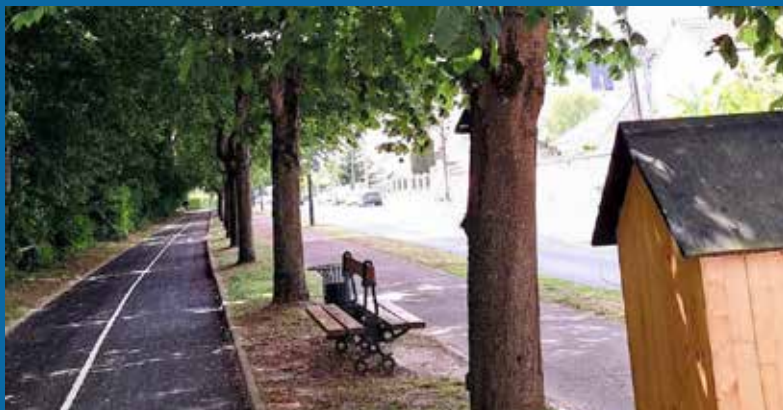
Rénovation de la piste cyclable de l'avenue Charles de Gaulle et raccordement des bâtiments publics et de la résidence La Forêt à la géothermie