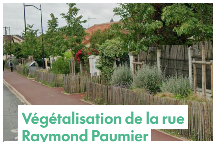
Végétalisation de la rue Raymond Paumier

Mise en place d'une permanence du Maire au coeur du quartier