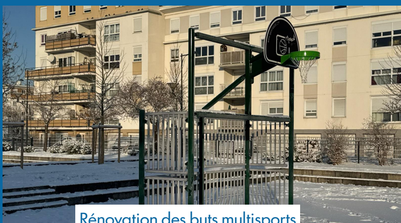
Rénovation des buts multisports