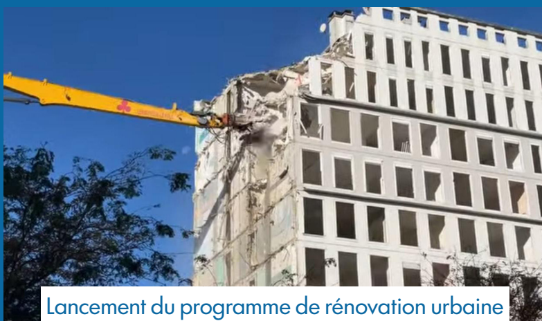
Lancement du programme de rénovation urbaine de l'Oly et démolition de la Tour F