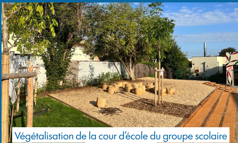
Végétalisation de la cour d'école du groupe scolaire Hélène Boucher