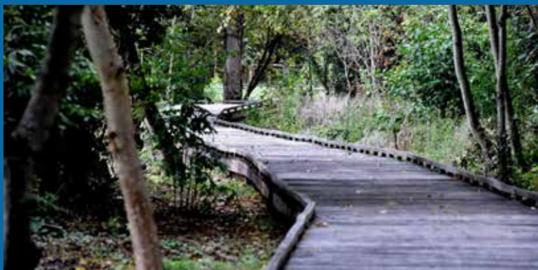
Requalification de la promenade le long des berges de l'Yverres et réalisation d'un platelage