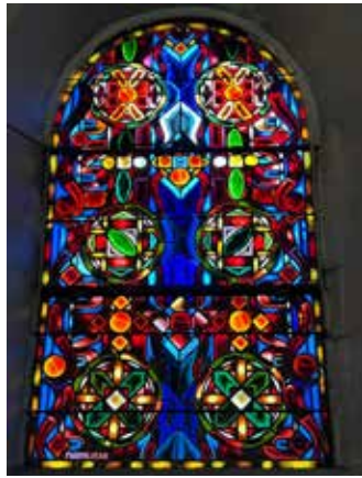
Rénovation des vitraux de l'église Saint-Jacques

Réalisation d'un aménagement avec le SyAGE dans la plaine de Chalandray pour lutter contre les inondations et créer un milieu favorable à la biodiversité