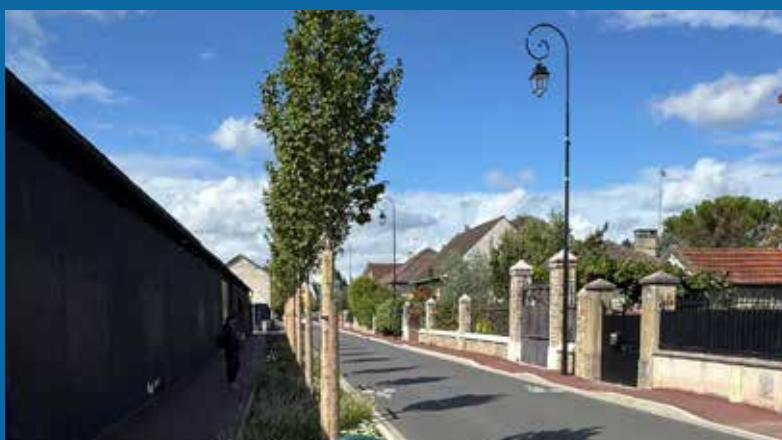
Rénovation de la rue de Concy et enfouissement des réseaux