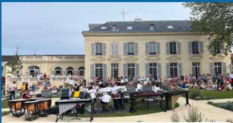
Restauration et extension du conservatoire de musique et de danse en lien avec la CAVYVS